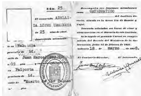
Fotografia 9. Certificat de treball de l'Institut-Escuela de València d'Adelaida López (APLBI)