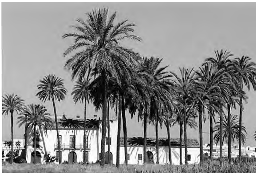
Fotografia 1. Hort de les Palmes en 1998, quan encara mantenia la seua esplendor